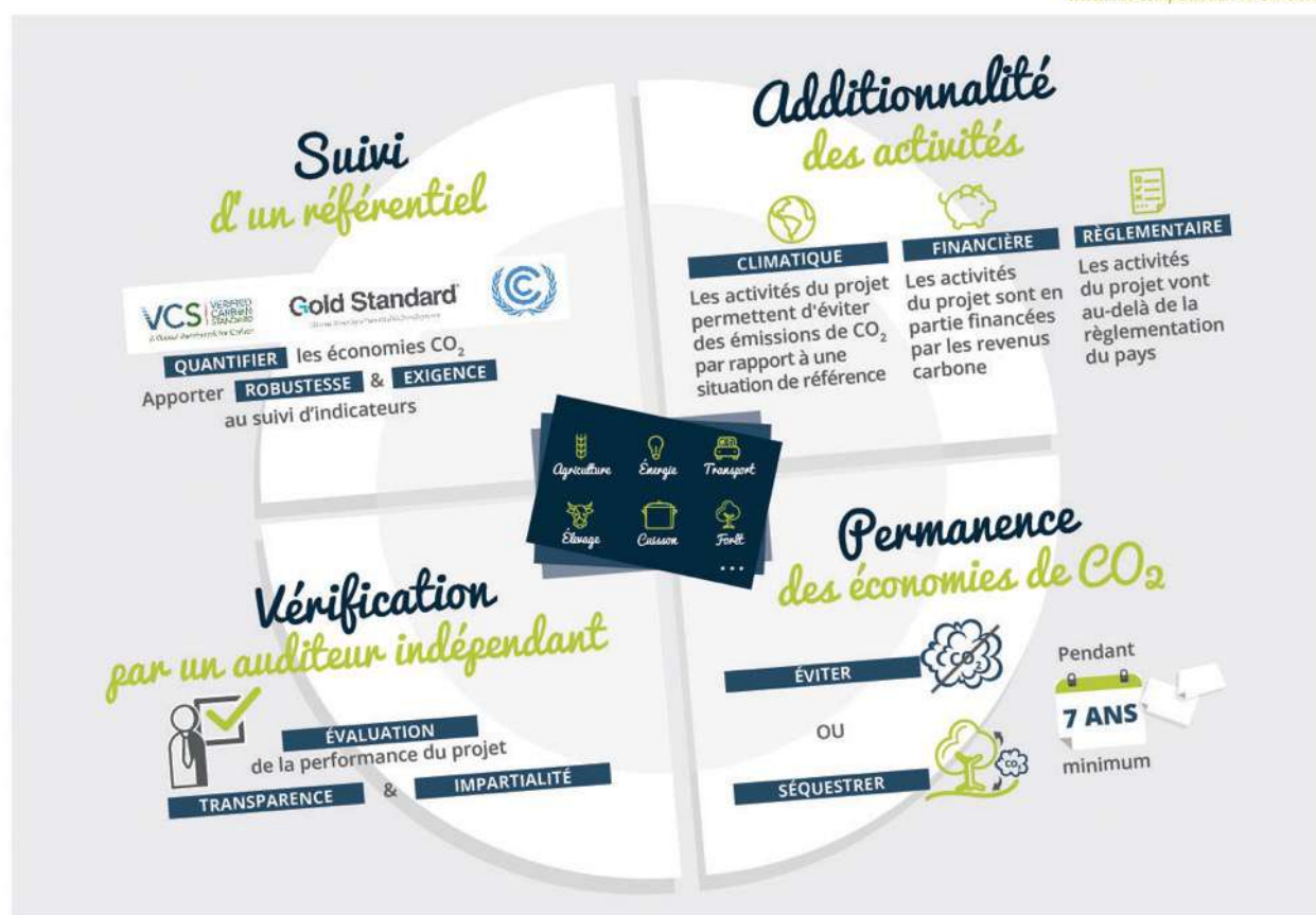
Figure 2 : document INFC

De nombreuses possibilités existent, certaines d'entre elles bénéficient de labels qui garantissent l'intégrité de la démarche.