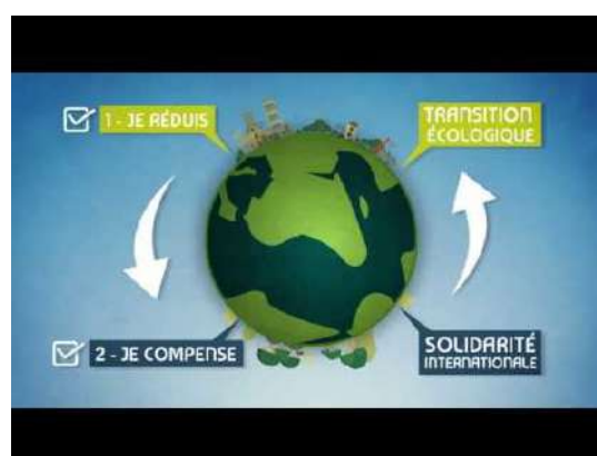
Figure 1 : document source IFNCC

« Dans le cadre particulier du volontariat, la compensation volontaire vise plus spécifiquement le recours à ce processus par des acteurs qui ne sont pas soumis à une contrainte réglementaire pesant sur leurs émissions de gaz à effet de serre (comme par exemple dans le système communautaire d'échange de quotas d'émission), ou qui souhaitent aller au-delà de leurs obligations. » (Source : ADEME)